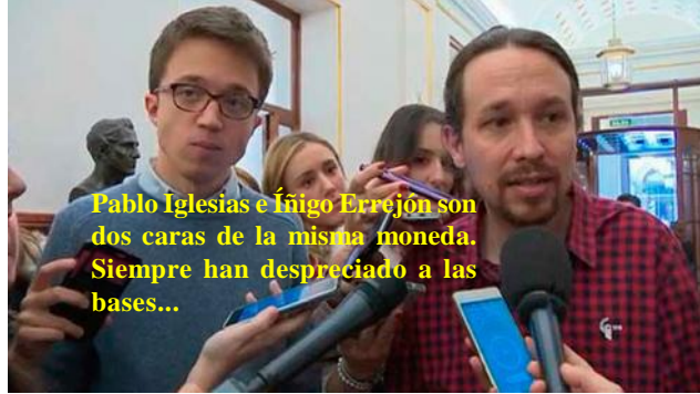
Pablo Iglesias e Íñigo Errejón son dos caras de la misma moneda. Siempre han despreciado a las bases...

Poco a poco Carmena y su equipo de incondicionales —entre ellos José Manuel