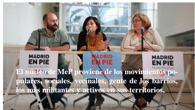
El núcleo de MeP proviene de los movimientos populares, sociales, vecinales, gente de los barrios, los más militantes y activos en sus territorios.

En definitiva, no cabe duda de que las campañas electorales no resuelven los problemas de las gentes. Tenemos nuevos retos en el horizonte. Como por ejemplo construir la unidad. Cuando hemos ido en unidad hemos tenido mejores resultados. Construyamos poder popular, construyamos nuestra herramienta el MeP, barrio a barrio, pueblo a pueblo, distrito a distrito. Sólo el pueblo salva al pueblo.