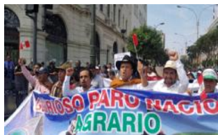
Paro a la implementación de la Ley de la Agricultura Familiar, que permitiría entre otros beneficios, reclamar el 10% del presupuesto que

Las demandas más importantes giran en to-