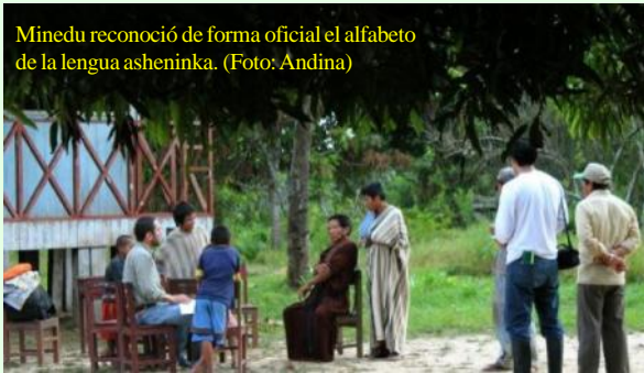
Minedu reconoció de forma oficial el alfabeto de la lengua asheninka.

El alfabeto de la lengua asheninka contiene de 22 letras o grafías, conforme a la Dirección de Educación Intercultural Bilingüe, que emitió la Resolución Directoral N° 0001-2019- MINEDU/ VMGPDIGEIBIRA-DEIB.