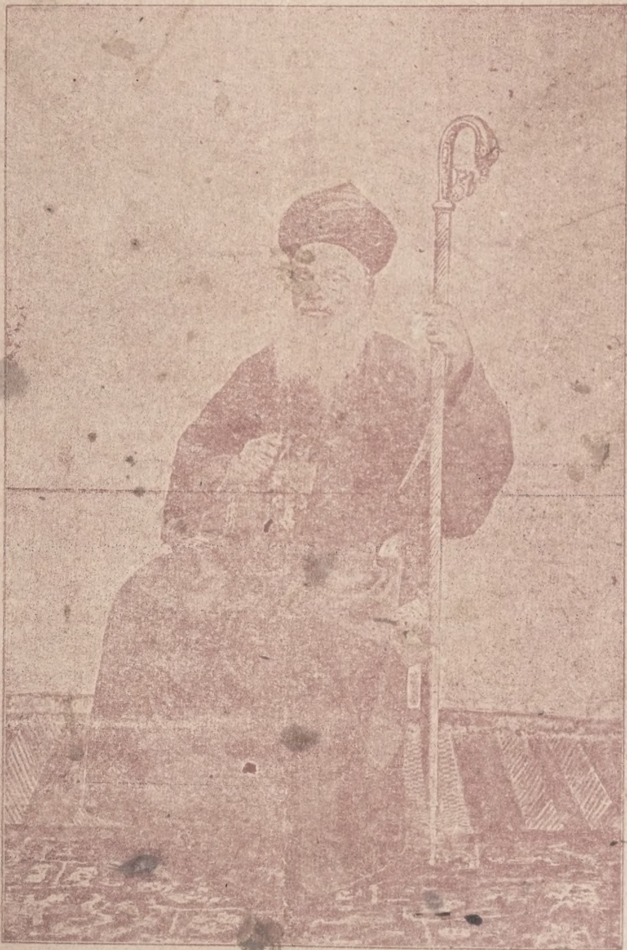
കടവിൽ മാർ അരുണാനന്ദസ്യംസ് മെത്രാപ്പോലീത്താ തിരുമനസ്സുകൊണ്ട്—ഒൻമ തുലാം 20.

പുസ്തകം 5 | 1950 നവംബർ * തുലാം 1126 | ലക്കം 1