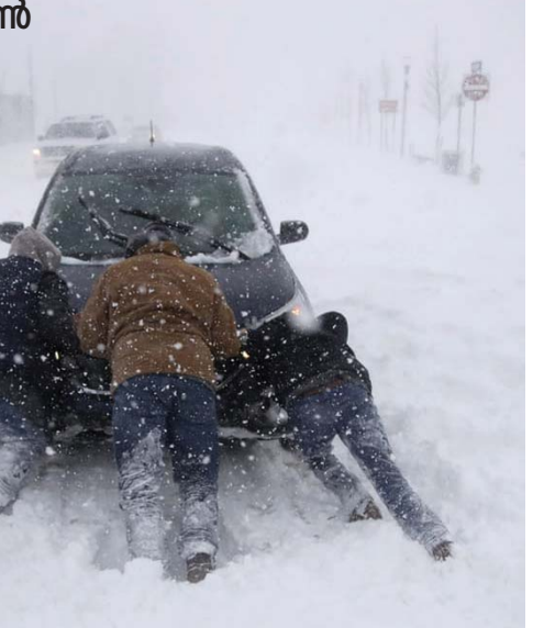
ബോംബ് ചൂഴലി കാറ്റിനെ തുടർന്ന് മഞ്ഞിനടിയിലായ കാർ തള്ളിനിന്നാണ് പ്രതിരോധം