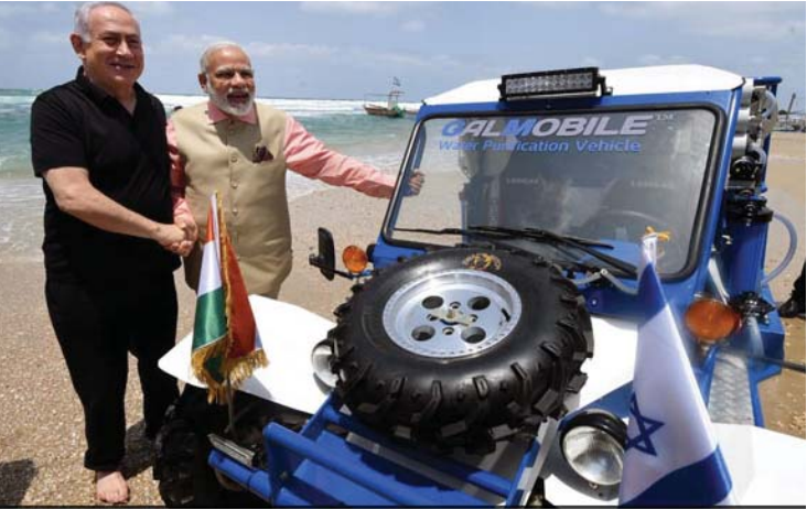
നെതന്യാഹൂറിനൊപ്പം മോദി ജിപ്പിനരികെ

ജിപ്പ് കണ്ടുമോദി പറഞ്ഞത് ഈ വാഹനം കാണിച്ചതിന് നെതന്യാഹൂറിന് ഞാൻ നന്ദി പറയുന്നു.