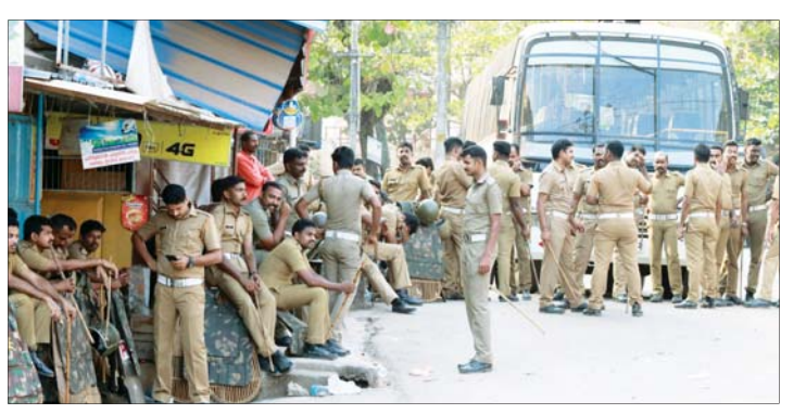
സംഘർഷത്തെ തുടർന്ന് പൊലീസിനെ വിതര കലുക് ജംഗ്ഷനിൽ വിന്യസിച്ചപ്പോൾ

വിതര: കലുക് ജംഗ്ഷനിലെ പ്രതിഷേധത്തിലേ പ്രതികരണനാരോപിച്ചു പൊലീസ് കസ്റ്റഡിയിലെടുത്തവരെ വിട്ടയക്കണമെന്നാവശ്യപ്പെട്ട് വിശ്വാസികൾ വിതര പൊലീസ് സ്റ്റേഷൻ മുന്നിൽ മണിക്കൂറുകളോളം കത്തിയിരുന്ന് പ്രതിഷേധിച്ചു. ഇനലെയെ വൈകിട്ട് മുന്നോടെ കലുക് ജംഗ്ഷനിൽ നടന്ന സംഘർഷത്തിൽ പൊലീസിനെതിരെ കല്ലെറിഞ്ഞ കേസിൽ പിടികെടുത്തവരെ വിട്ടയക്കാനാവശ്യപ്പെട്ടിരുന്ന സമരം, സ്റ്റേഷന്റെ കവാടം കടന്ന് ഏറെ ഉള്ളിലായാണ് വിശ്വാസികൾ നിലയുറപ്പിച്ചിരുന്നത്. സ്ത്രീകളും വൈദികരും കസ്റ്റഡിയിലെടുത്ത വിശ്വാസികൾ സ്റ്റേഷൻ മുന്നിൽ മണിക്കൂറുകൾ കാത്തിരുന്നു.