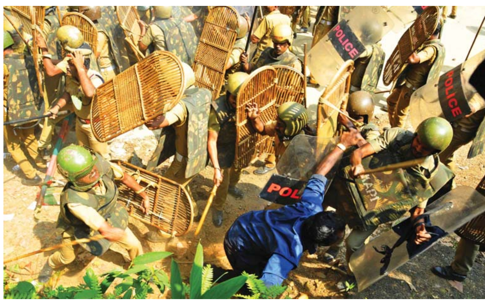
ബോണക്കാട് കുരിശുമലയിലേക്കുള്ള യാത്ര കാനിത്തടം ഹോസ്റ്റൽ പൊട്ടിപ്പോയിൽ പൊലീസ് ലാത്തിവീശിയപ്പോൾ

വിതര: ബോണക്കാട് കുരിശുമല തീർത്ഥാടനയാത്ര തടഞ്ഞതിനെത്തുടർന്നുണ്ടായ റോഡ് ഉപരോധവും സംഘർഷവും വിതര കലുക് ജംഗ്ഷൻ മണിക്കൂറുകളോളം യുദ്ധങ്ങളാക്കി. യാത്ര തടഞ്ഞതിൽ പ്രതിഷേധിച്ചു വിശ്വാസികൾ ഉച്ചതിരിഞ്ഞ് മുന്നോടെ ബോണക്കാട് നിന്ന് വിതര ജംഗ്ഷനിലേക്ക് വാഹനങ്ങളിലെത്തിയെന്നു.