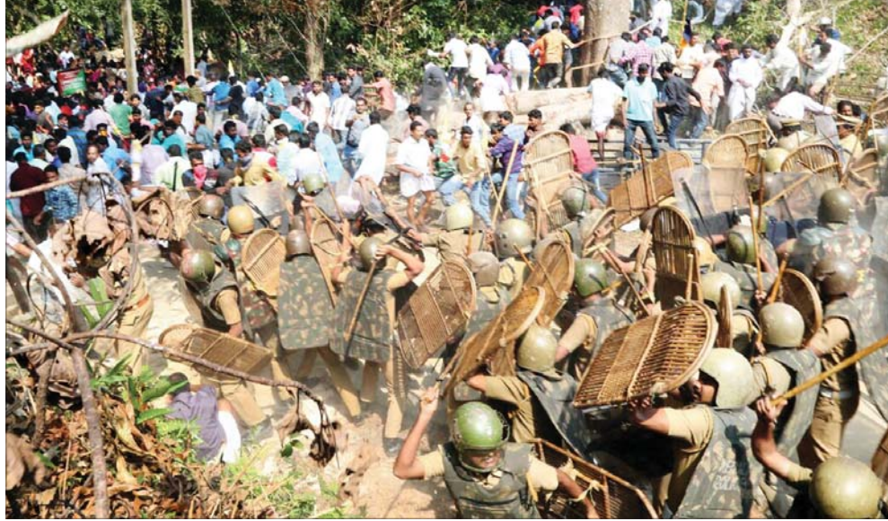
ബോണക്കാട് കുരിശുമല യാത്ര തടഞ്ഞു. പൊലീസുകാർ ഉൾപ്പെടെ എഴുപത് പേർക്ക് പരിക്ക്

വിതുമ്പലും കുരിശുമല യാത്ര തടഞ്ഞു. സംഘർഷത്തിൽ സി.എ.ആർ.എസ്.യുടെ നേതൃത്വത്തിൽ ഉദ്യോഗസ്ഥർക്കും വൈദികരുടെയും വിദ്യാർത്ഥികൾക്കും പരിക്കു ലഭിച്ചു. ലാത്തിച്ചാർജ്ജ് കഴിഞ്ഞ് കേരളാ പോലീസ് കോർട്ടിൽ കേസെടുത്തു.