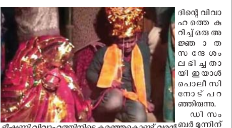
ദിശ്വേ വിവാഹം കഴിഞ്ഞ് തോക്കുചൂണ്ടി വിവാഹം